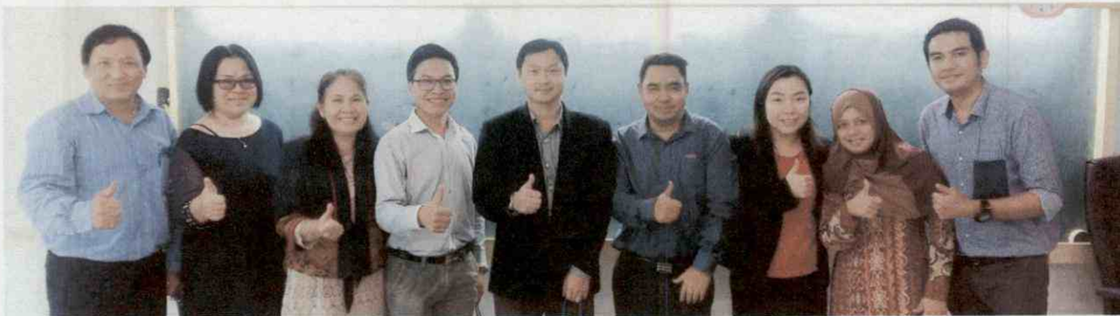
ภาพประกอบกิจกรรมการตรวจประเมินคุณภาพการศึกษาภายใน ระดับหลักสูตร ประจำปีการศึกษา 2558 หลักสูตร ศษ.บ. สาขาวิชาเทคโนโลยีสารสนเทศการศึกษา วันที่ 18 สิงหาคม 2559